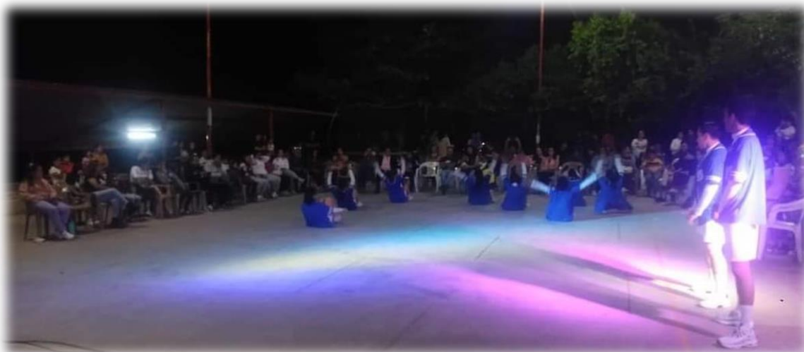
Ballet de Jazz del Centro Cultural Regional de El Grullo