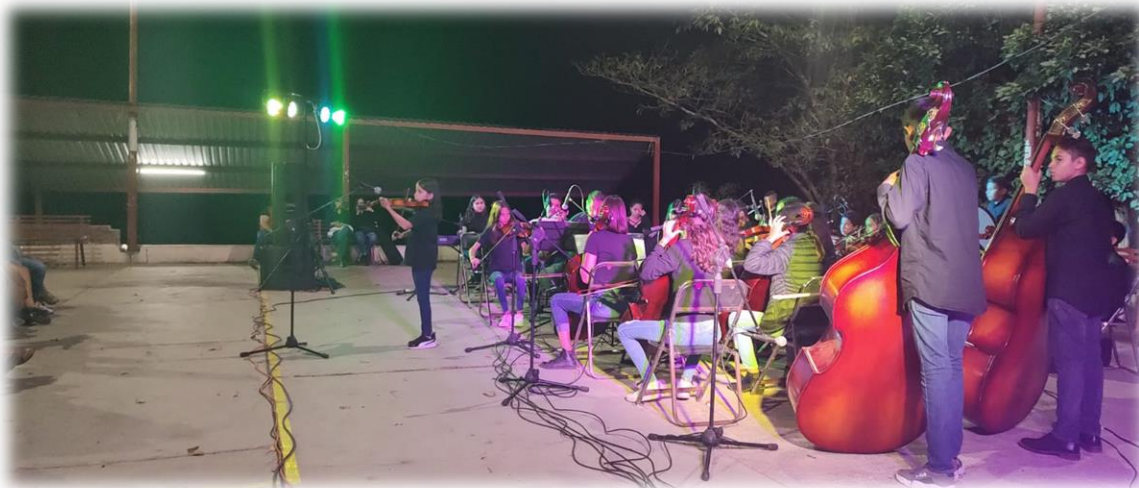
Orquesta sinfónica Grullense

Lunes 6 de febrero: Durante las tradicionales fiestas culturales en la localidad de El Cacalote, se realizaron eventos culturales artísticos, el cual iniciaron con la presentación de la Orquesta Sinfónica Grullense del Centro Cultural.