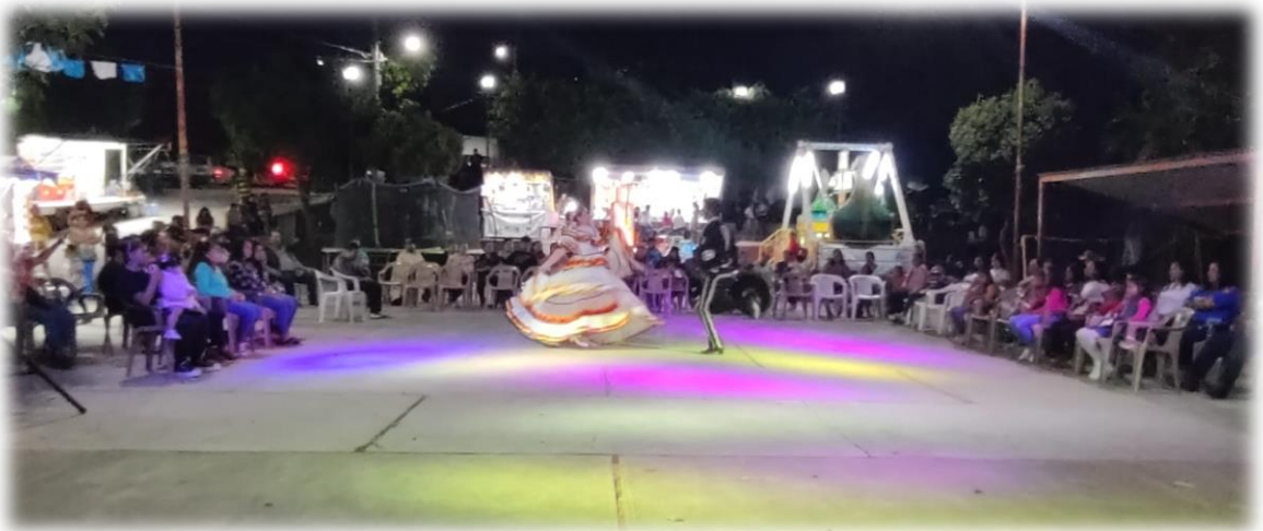
Ballet Folclórico del Centro Cultural Regional de El Grullo.