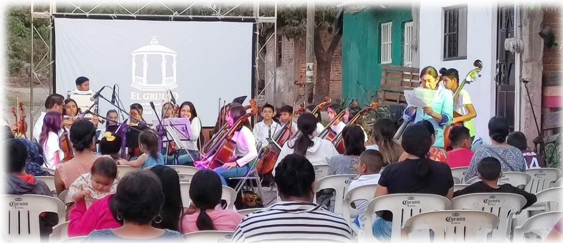
Colonia: Charco de los Adobes, presentación de la Orquesta Sinfonica Grullense y Cine al Aire Libre

El trabajar para nuestras colonias es de suma importancia para la dirección de cultura ya que estamos proyectando cines al aire libre, serenatas con el fin de lograr el tejido social entre los colonos y una sana convivencia.