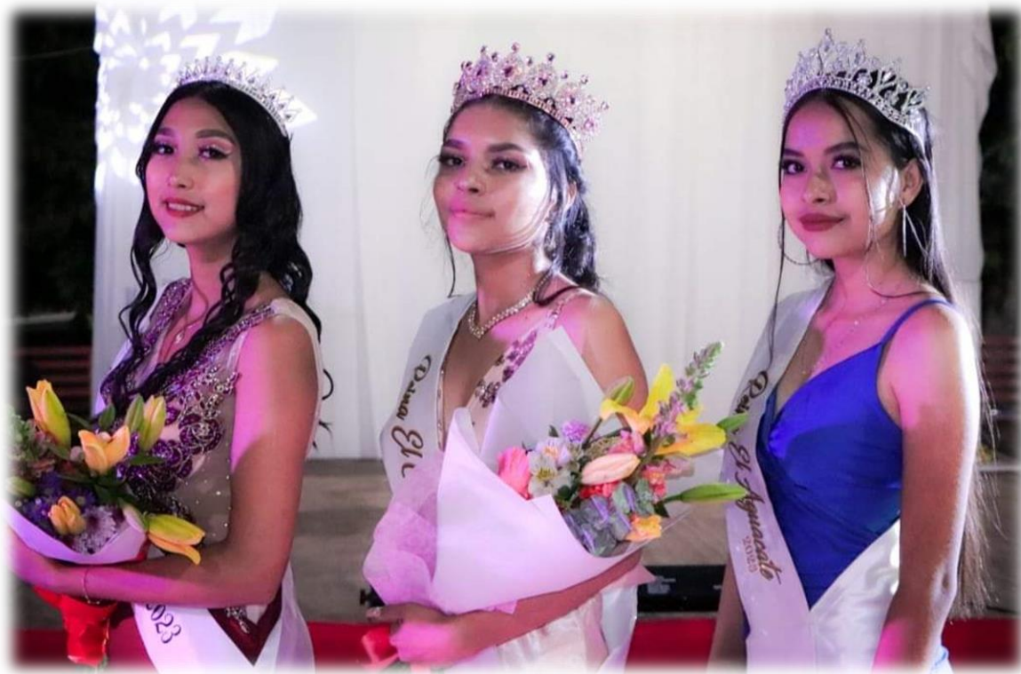
Princesa El Cacalote 2023, Reina El Cacalote 2023, Reina El Aguacate 2023