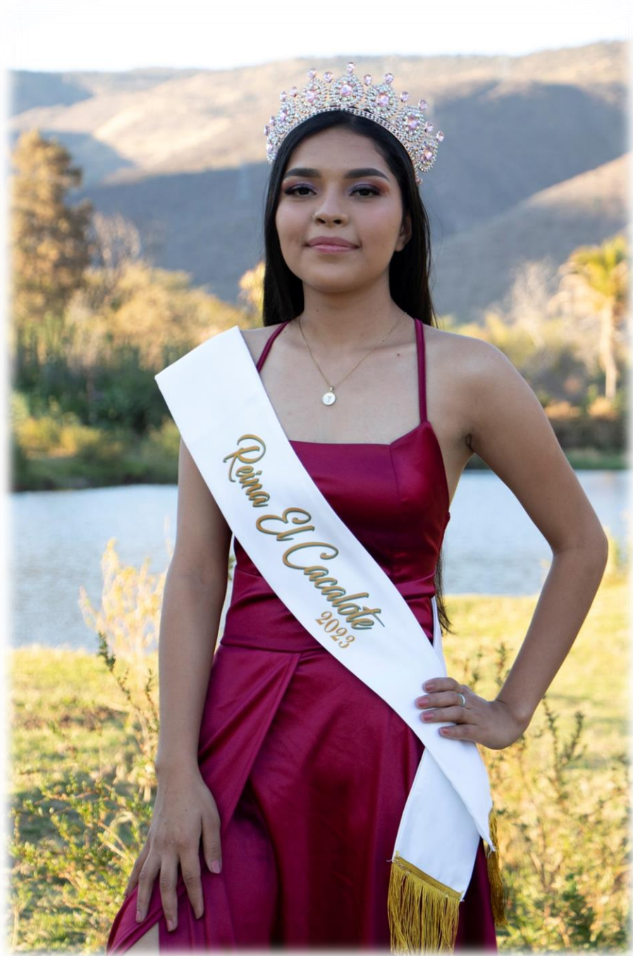
Reina El Cacalote 2023