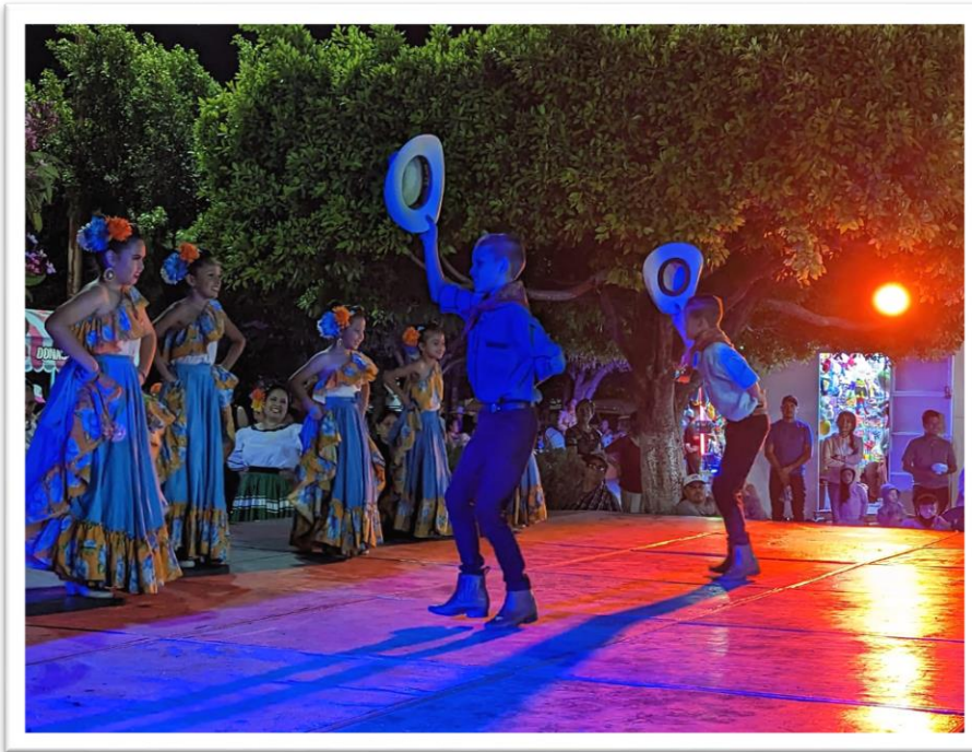
Domingo30: Participación en el Festival La Ciudad de los Peques, en el foro Valente Pastor, ubicado en el Paseo Comercial, Cultural y Deportivo de El Grullo.