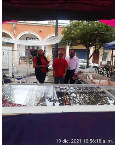
19 dic. 2021 10:56:18 a. m.