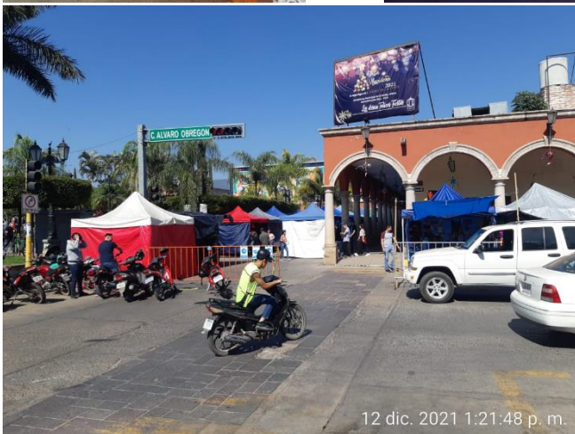
12 dic. 2021 1:21:48 p. m.