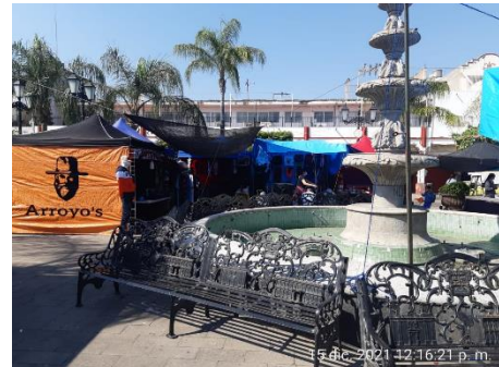
12 dic. 2021 12:16:21 p. m.