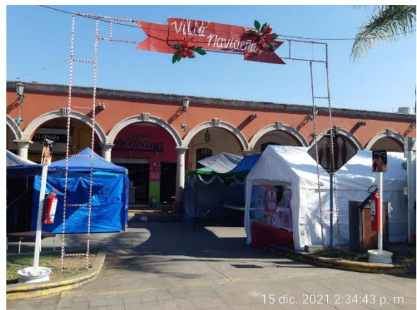
15 dic. 2021 2:34:43 p. m.