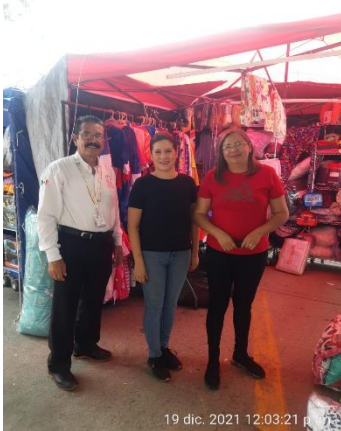
19 dic. 2021 12:03:21 p. m.