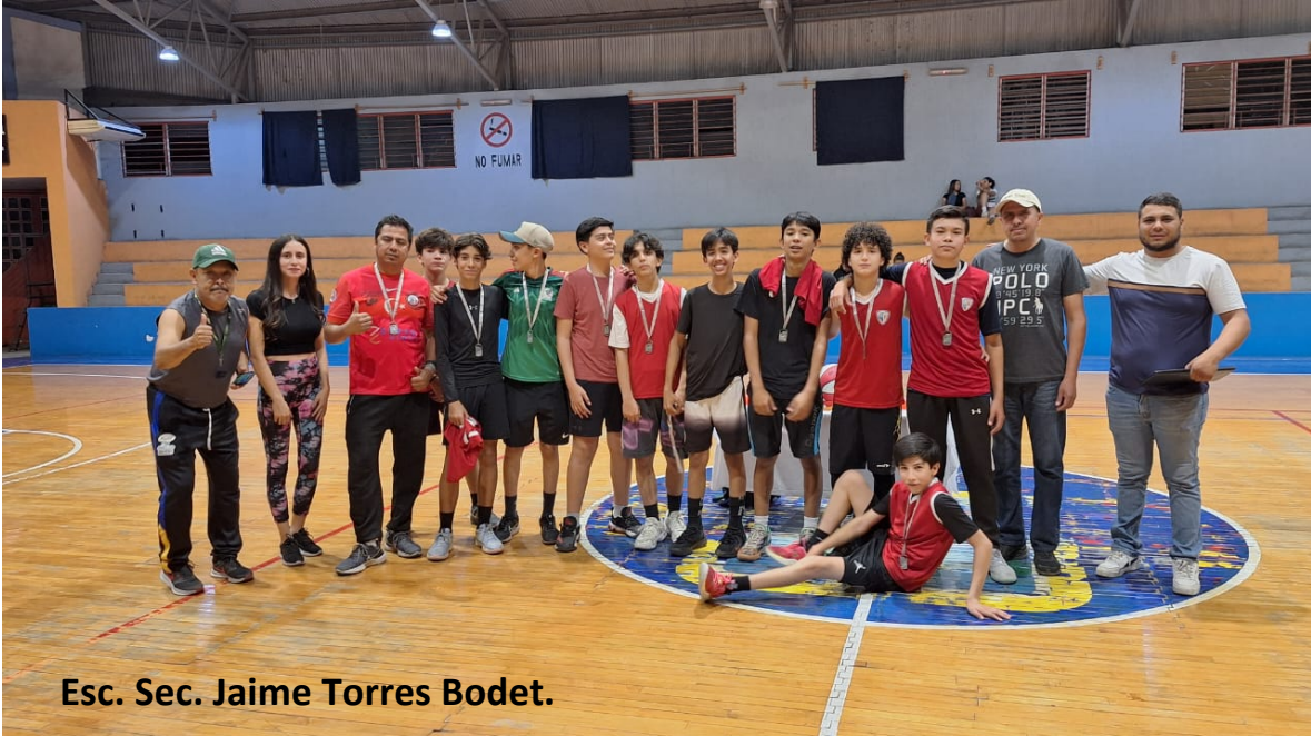
Esc. Sec. Jaime Torres Bodet.