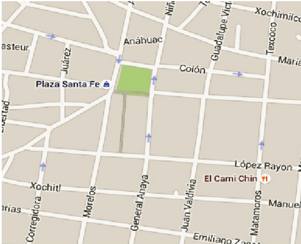
Captura de una imagen de Google maps

Ubicación de la oficina Álvaro Obregón No. 48, Colonia Centro, El Grullo, Jalisco.