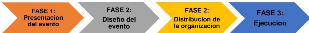
DIAGRAMA DE PREPARACION DE EVENTOS:

El diagrama de flujo o también diagrama de actividades es una manera de representar gráficamente un algoritmo o un proceso de alguna naturaleza, a través de una serie de pasos estructurados y vinculados que permiten su revisión como un todo